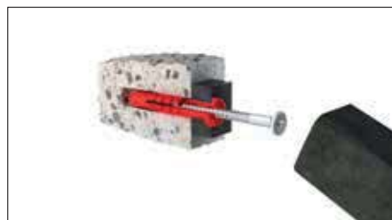
Zatlukáním do betonu