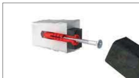
Zatlukáním do sádry