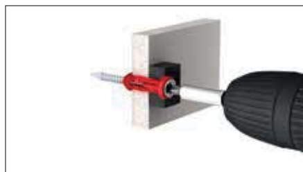
Šroubováním do sádkkartonu