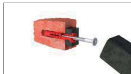
Zatlukáním do plné cihly