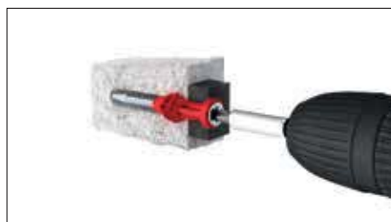
Šroubováním do pórobetonu