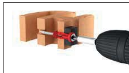
Šroubováním do duté cihly